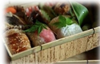
開田高原旬菜弁当